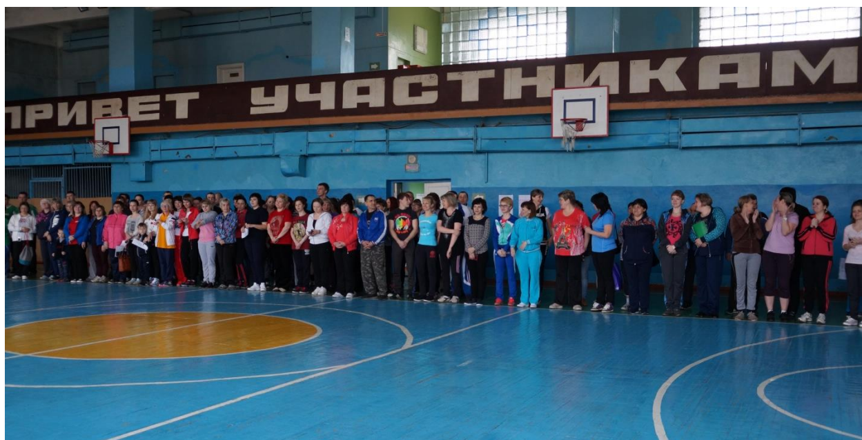
Участники спортивного праздника во время общего построения.

18 марта 2017 года двери МБУ ДО ДЮСШ г.Грязи распахнулись для всех жителей нашего района, пожелавших приобщиться к общероссийскому спортивному движению. Несмотря на массовость, мероприятие прошло на высоком уровне, чему в немалой степени способствовала серьезная подготовительная работа. Во-первых, информация о событии была заблаговременно размещена на официальном сайте детско-юношеской спортивной школы (в нескольких разделах) и на страницах районной газеты «Грязинские известия». Во-вторых, было проведено оперативное совещание судейской бригады, на котором обсуждались нюансы приема нормативов среди взрослого населения (к примеру, вид «Сгибание и разгибание рук» имеет три вариации в IX, X и XI ступенях комплекса ВФСК ГТО). В-третьих, в рамках межведомственного взаимодействия согласовывались вопросы оказания медицинской помощи и музыкального сопровождения.